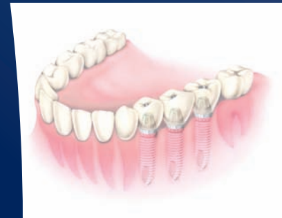
Naar brug op implantaten